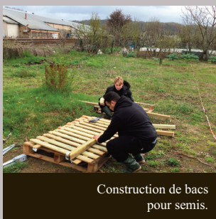
Construction de bacs pour semis.