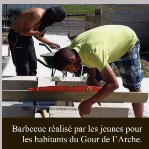
Barbecue réalisé par les jeunes pour les habitants du Gour de l'Arche.