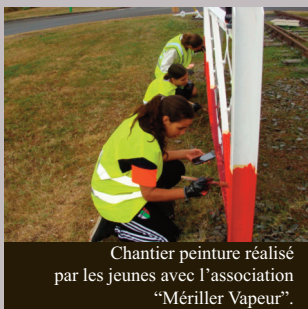
Chantier peinture réalisé par les jeunes avec l'association "Mérillier Vapeur".