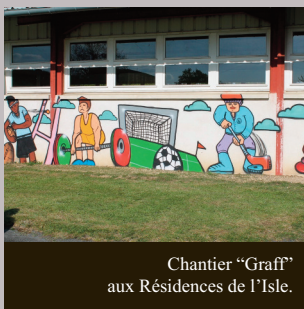
Chantier "Graffiti" aux Résidences de l'Isle.