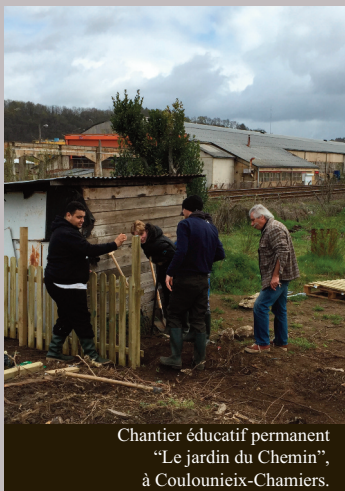
Chantier éducatif permanent "Le jardin du Chemin", à Coulounieix-Chamiers.